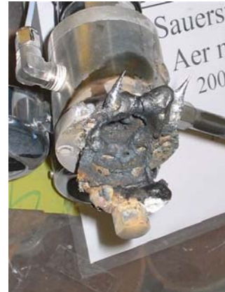
Bilder 3 und 4 ausgebrannte Druckminderer